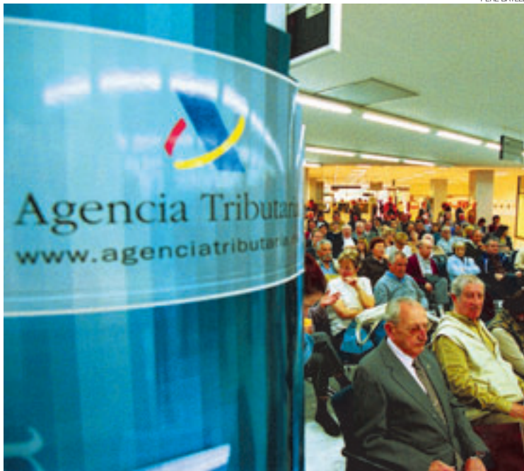
El secret més ben guardat és el diferencial entre els impostos que paga Catalunya i el que recupera.