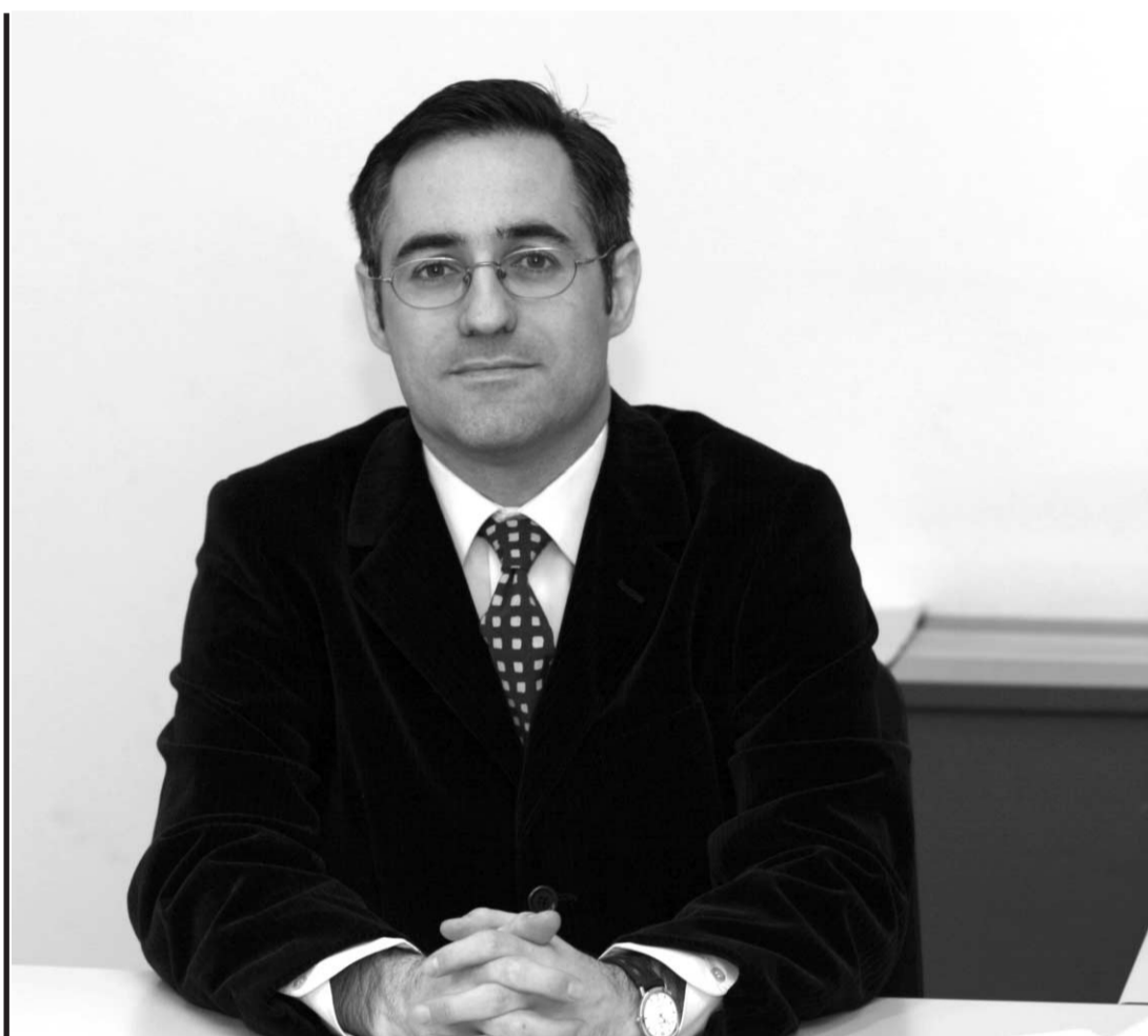
L'economista català considera que el dèficit fiscal arriba a “corcar la cohesió social de Catalunya”

“El PSC té una ocasió única per fer alguna cosa per l'autogovern de Catalunya, tot i que no crec que facin res”