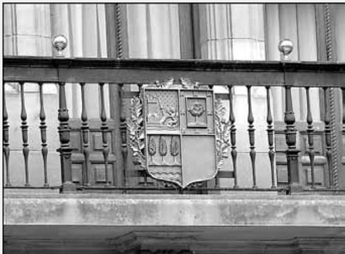
Façana del Palau d'Ajuria Enea, a Vitòria

Des del govern basc s'han queixat en els darrers anys que la despesa pública de l'Estat ha estat mínima. Havent pogut accedir a la distribució d'un 40% de la mateixa per territoris entre 1997 i 2003, el País Basc només en va rebre el 0,77% del total en mitjana anual, quan representa el 5% de la població i 6,5% del PIB estatals ( El Temps , 1062). Tot i això el nou concert econòmic basc, aprovat en un clima de màxima tensió política entre Madrid i Vitòria a finals del 2001, suposa un pagament del govern basc de 2.000 milions d'euros anuals a l'Estat, un 4,1% del PIB basc de 2003, xifra que inclou una contribució a la solidaritat, per tal com supera amb escreix la despesa pública que el govern central realitza a Euskadi. Una contribució anual del sector públic central del 23% del seu PIB, com sembla que seria la basca actualment, és perfectament compatible amb la que realitzen els Estats nord-americans i els lands alemanys més productius amb els respectius governs centrals, i a la qual els catalans hauríem d'aspirar.